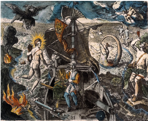
Grabados de Theodore De Bry del libro Collectiones peregrinationum in Indiam orientalem et Indiam occidentalem (1590–1633) relacionados con al expedición de Magallanes.

En cualquier caso, si sumamos a los dieciocho supervivientes de la Victoria los trece liberados de Cabo Verde, podemos obtener un total de treinta y una personas.