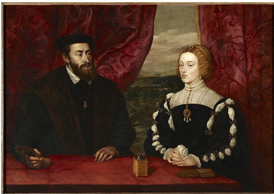
El emperador Carlos V y la emperatriz Isabel de Portugal (Rubens, Peter Paul, copia de Tiziano). Colección de la Fundación Casa de Alba. Palacio de Liria (Madrid).