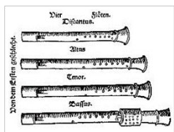
Musica Instrumentalis Deudsch (1529) de Martin Agricola

Citamos en primer lugar el tratado Sebastian Virdung titulado Musica Getutsch , publicado en 1511, en el que encontramos varias ilustraciones de la flauta de pico. Para referirse concretamente a la flauta travesera, Virdung (1511) emplea el término Zwerchpfeiff . Resulta especialmente reseñable que es la flauta el único instrumento del que Virdung detalla sus posiciones. Adicionalmente, en el tratado de Virdung (1511) encontramos la descripción de varias flautas: una flauta de tres agujeros, una soprano en sol , una flauta tenor en do y una baja en fa , así como un gemscorno (Gemshorn) o pequeña flauta de cuatro agujeros.