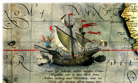
Nao Victoria. Detalle de un mapa de Abraham Ortelius (1590)