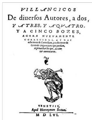
Cancionero de Uppsala (o del Duque de Calabria). Obra impresa en 1556.

3 Biblioteca del Museo Arqueológico de Madrid, Grupo de investigación IDEA Lab, Madrid, España.