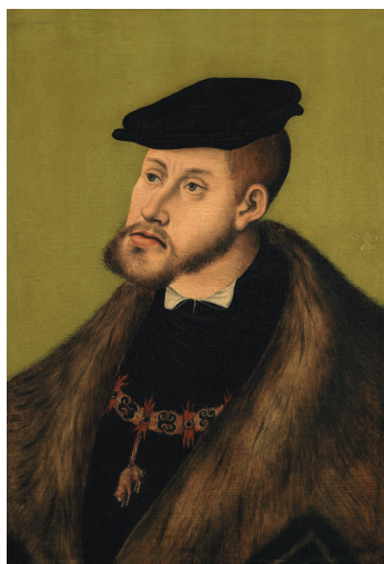
Retrato de Carlos V. Lucas Cranach "El Viejo" (1533). Museo Nacional Thyssen-Bornemisza. Madrid

En la serie de paneles La música como herencia. El "árbol genealógico musical" de Carlos V ha quedado patente la presencia de la música en la vida de Carlos de Habsburgo (1500-1558) desde niño, desde los inicios de su educación y como hilo conductor de su herencia familiar.