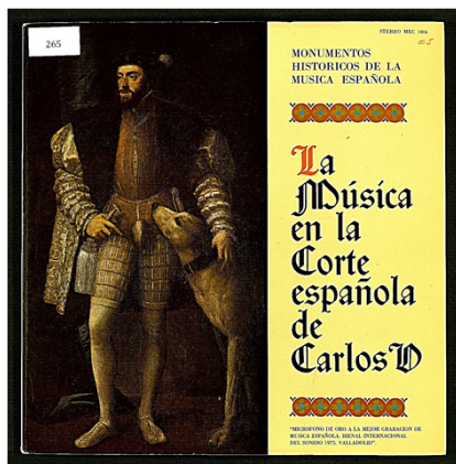
Portada del disco de vinilo "La Música en la Corte española de Carlos V" de la colección Monumentos Históricos de la Música Española. Disco disponible en la Fonoteca de la Biblioteca Central Militar.

2 Biblioteca del Museo Arqueológico de Madrid. Grupo de investigación IDEA Lab, Zaragoza, España. S.cobo@ucm.es