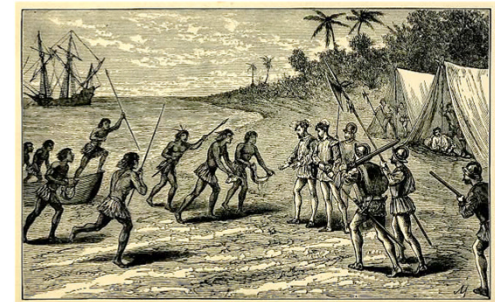
Encuentro con los nativos. Grabado del libro de George M. Towle (1902). Magellan; or, the first voyage round the world .