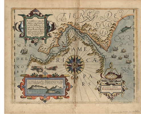
Mapa del estrecho de Magallanes. Hondius, J. (1611). Exquisita & magno aliquot mensium periculo lustrata et iam relecta Freti Magellanici facies .

El día 27 de noviembre de 1520 las tres naos que quedaban lograron salir del Estrecho al Mar del Sur, al que debido a la calma de sus aguas llamaron el Pacífico (Corral, 2019). Durante más de tres terribles meses, sin apenas víveres y agua, ya que se encontraban en la nave desertora, la San Antonio , recorrerán la inmensidad del océano Pacífico , sin avistar tierra.