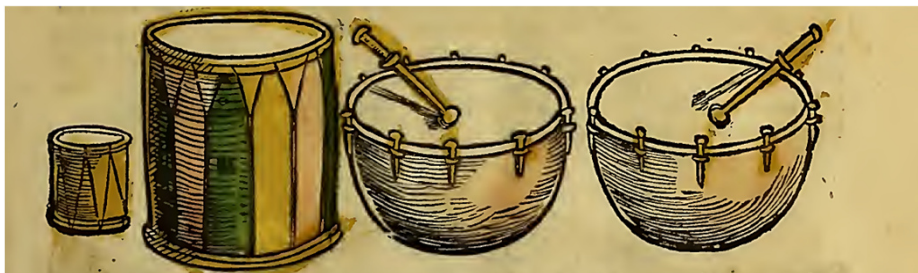
Sebastian Virdung (1511). Musica Getuscht . Instrumentos de percusión.

Además de estas audiciones recomendadas, invitamos a deleitarse con el conjunto de diferentes timbres y sonidos de la polifonía e instrumentos de nuestra época de referencia explorando el conjunto de objetos digitales disponibles la Sala Fonoteca de esta exposición virtual.