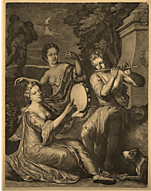
Compañía de música. Gerard Hoet (I), 1656 – 1733. Rijksmuseum. Amsterdam (Países Bajos)

2 Universidad Rey Juan Carlos, Grupo de investigación IDEA Lab, Madrid, España