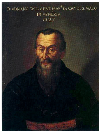
Retrato del compositor Adrian Willaert

3 Grupo de investigación IDEA Lab, Madrid, España.