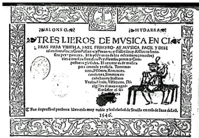
Portada de "Tres libros de música de cifra para vihuela" (Sevilla, 1546) de Alonso Mudarra.