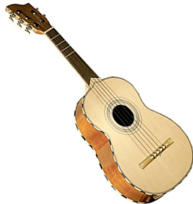
La vihuela de mano fue el instrumento de moda cortesano en la España del Renacimiento.

2 Universidad Complutense de Madrid, Grupo de investigación IDEA Lab, Madrid, España. carquero@ucm.es