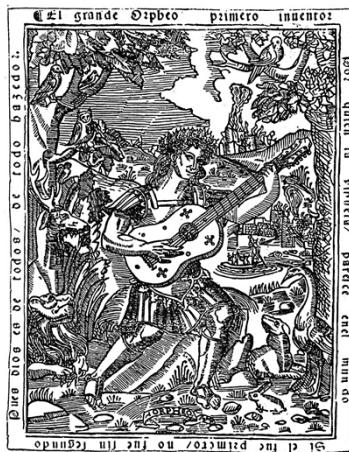
Orfeo tocando una vihuela. Grabado de El Maestro (1536) obra del compositor y vihuelista Luis de Milán.