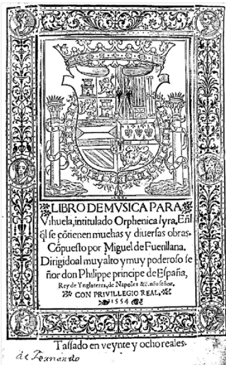
"Orphénica lyra" (Sevilla, 1554) obra de Miguel de Fuenllana