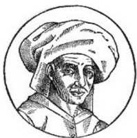
Xilografía con la imagen del compositor Josquin Desprez

3 Museo Arqueológico de Madrid. Grupo de investigación IDEA Lab, Madrid, España.